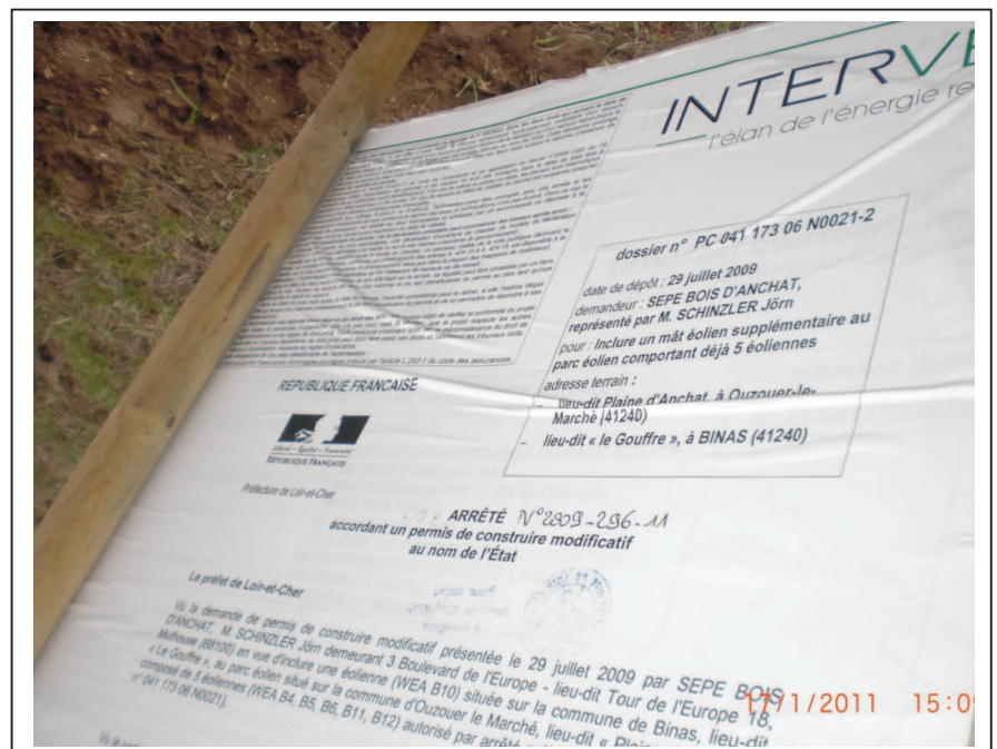
Verso du panneau. 17 janvier 2011. PC modificatif pour un 6 ème mât supplémentaire aux cinq initiaux.